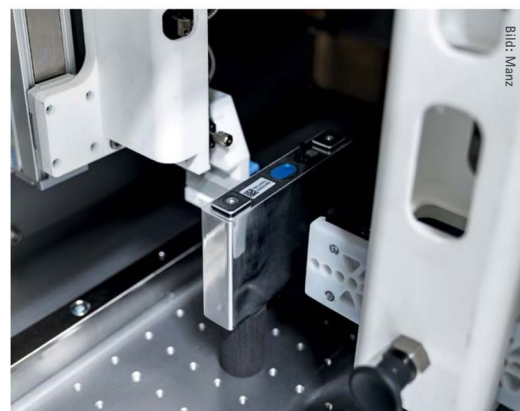
Das Innenleben der Batteriezellenprüfanlage von Xarion und Manz: Hier werden auf der einen Seite der Zelle mit einem Laser Ultraschallsignale erzeugt und auf der anderen Seite mit Xarions Mikroskop analysiert. Dabei ist kein Wasser oder Gel nötig.