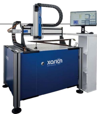
Ein LEAsys-Laborgerät für den Einsatz in F&E-Abteilungen und Forschungsinstituten: Mit dieser vielseitigen und bedienerfreundlichen Station lassen sich vielfältige Prüfaufgaben erfüllen. Oft stellen diese Laborgeräte auch die Vorstufe zum Sprung in die vollautomatisierte Anlage für die Produktionslinie dar.

auch in einer Vielzahl von fertigenden Industrien. Diese Technik nutzt Schallwellen, die für das menschliche Ohr nicht hörbar sind. Es werden aus dem Echo der Ultraschallwellen Bilder hergestellt, die über die innere Beschaffenheit Auskunft geben und somit Informationen zur Verfügung stellen, die dem menschlichen Auge oder einer Kamera nicht zugänglich sind. In herkömmlichen Ultraschallanwendungen wie etwa in der Medizin wird ein Kontaktgel oder Wasser verwendet, um die Schallwellen effektiv vom Gerät in den Prüfling und umgekehrt zu übertragen. Das Kontaktmedium dient dazu, Luft zwischen dem Ultraschallkopf und der Oberfläche zu eliminieren, die sonst die Schallübertragung stören würde. Setzt man ein herkömmliches Ultraschallgerät ein, ohne vorher ein Gel aufzutragen, gehen über 99 Prozent der Schallwellen an der Oberfläche durch Reflexion verloren, sodass kein Prüfbild erzeugt werden kann. Konventionelle Ultraschallprüfung ist zusätzlich sehr zeit- und arbeitsintensiv, da sie im Regelfall per Hand von einer ausgebildeten Fachkraft durchgeführt werden muss.