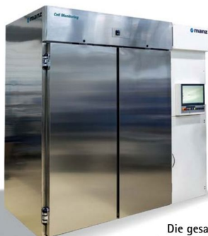
Die gesamte Prüfanlage von Xarion passt in dieses kompakte Gehäuse von Manz und kann per Knopfdruck von außen bedient werden.