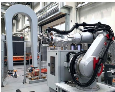
Prüfroboter für Kohlefaser-Verbundstoffe: Dieses Prüfsystem kommt in der Luft- und Raumfahrt zum Einsatz. Die Ultraschallprüfung ohne den Einsatz von Ultraschallgel oder Wasser bietet den Kunden großen Mehrwert, da das Bauteil nicht direkt berührt werden muss. Dieses Bild zeigt einen Aufbau in Durchschallung; auch einseitige Puls-Echo-Anordnungen sind möglich.

»Ultraschall ist im Allgemeinen die bevorzugte zerstörungsfreie Prüftechnik bei der Batterieprüfung. Er eignet sich besonders gut für die Beobachtung dünnster Flüssigkeits- und Gasgrenzflächen, selbst durch dickere Schichten hindurch. Solche feinen Grenzflächen sind für andere Methoden wie etwa die Computertomografie eine große Herausforderung. Die Prüfdauer pro Zelle würde Stunden dauern, vom Strahlenschutz ganz zu schweigen. Die Möglichkeit, die Verteilung der Paste unter der Oberfläche der Batteriemodule berührungslos mit Ultraschall zu prüfen, bietet die Chance, den Prüfprozess im Minuten- oder gar Sekundentakt zu automatisieren, was ein unglaublicher Mehrwert für unsere Kunden ist. Ohne unsere berührungslose Technologie müssten Automobilunternehmen z. B. ganze Module regelmäßig aus der Produktion nehmen und zerstörend prüfen, was natürlich mit immensen Kosten verbunden ist.«